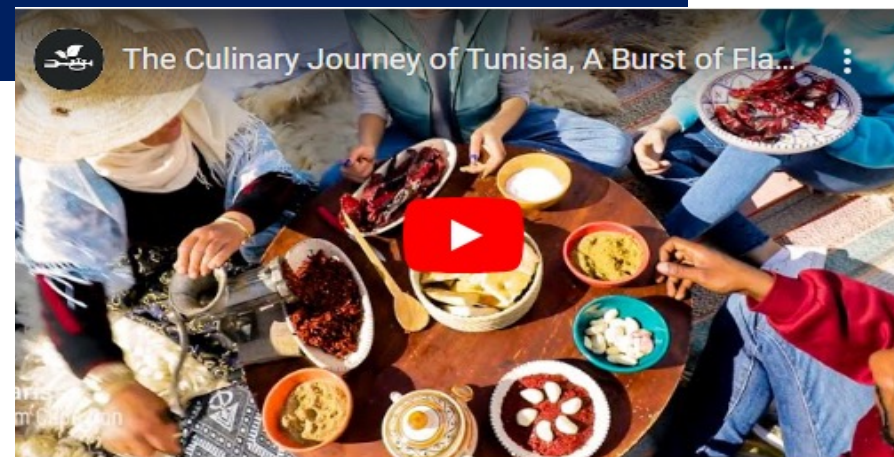
The Culinary Journey of Tunisia, A Burst of Flavors