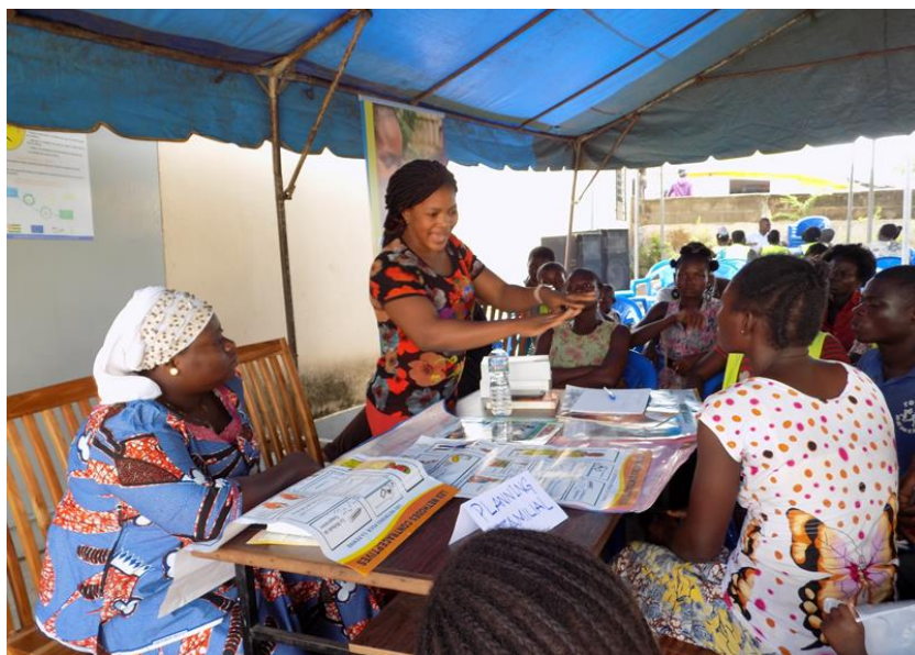
Projet de promotion du Planning Familial dans les Villes du Togo, UCT, ISSV

Dans le domaine de la santé sexuelle et reproductive, la capacité de décision et l'accès aux services pour les femmes sont des causes déterminantes de la santé et mortalité féminine. Plusieurs facteurs y contribuent :