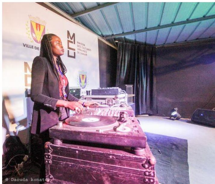
Projet Maison des Cultures Urbaines, AIMF-FDC, Dakar

Remarque pour aller plus loin : Cette approche Genre implique aussi d'intégrer le genre de manière transversale : (1) dans les modes de fonctionnement des institutions, (2) dans les compétences des personnels qui vont concevoir et gérer les projets.