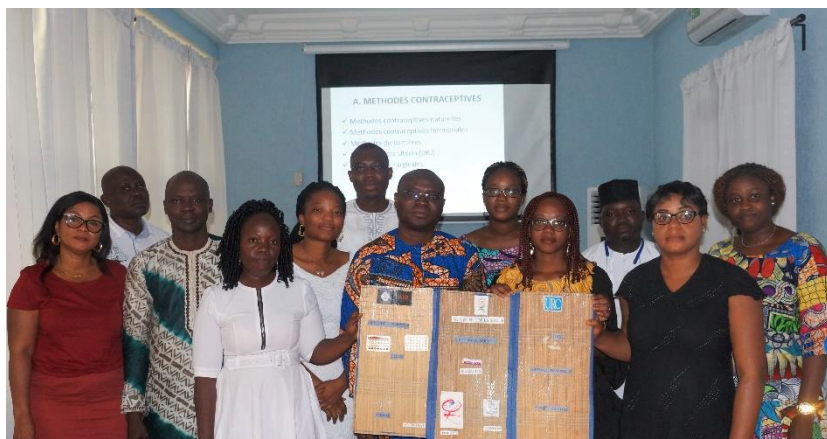
Projet de Promotion de la Planification Familiale dans les villes du Bénin, ANCB-ISSV