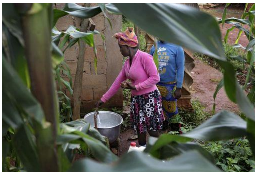
Projet MODEAB - Eau potable au Cameroun - AIMF-FDC

Le lien avec les objectifs de votre projet, notamment en termes de genre, peut être fait avec tous les Objectifs de Développement Durable (ODD) et les cibles en allant sur le site : https://www.globalcompact-france.org/documents/les-17-objectifs-de-developpement-durable-et-leurs-169-cibles-89 .