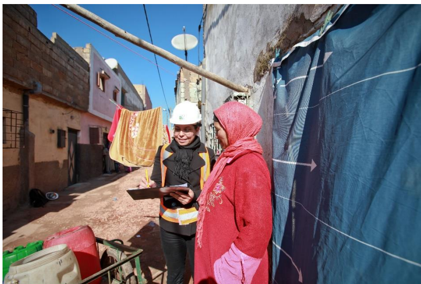
Projet Eau-assainissement dans les quartiers précaires, de Casablanca, AIMF-FDC

Les femmes sont aussi plus exposées au risque de contracter certaines maladies hydriques liées à l'eau et à l'assainissement, notamment le trachome, en raison de leur rôle de soignantes. Pendant l'accouchement, un environnement hygiénique, notamment de l'eau salubre, et une installation sanitaire sont d'une importance capitale pour la survie et la santé de la mère et de l'enfant. Le manque d'installations sanitaires adéquates peut exposer les femmes et les filles aux