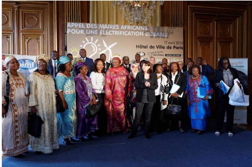
Projet REFELA - Femmes élues locales et énergie durable _ AIMF, FDC, Paris

L'intégration de l'approche genre dans les projets de développement des villes consiste à la fois à favoriser une prise de conscience et à introduire des stratégies et des outils adaptés. Elle encourage la prise en compte de l'égalité entre femmes et hommes, à travers l'intégration transversale du genre dans toutes les étapes de la gestion du cycle des projets ou des programmes, ce qui nous intéresse en premier ressort dans le cadre de ce Guide.