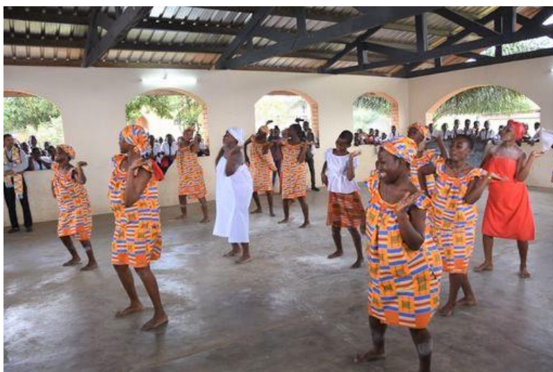
Projet de promotion de la Santé Sexuelle et Reproductive des Jeunes, Abidjan-ISSV

L'effectivité et la viabilité : Quelles actions ou activités bénéficieront directement aux hommes ? Aux femmes ? Aux groupes de femmes les plus marginalisés de la communauté ? Est-ce que le projet produira des bénéfices durables sur le long terme en matière d'égalité de genre ? Certaines actions ou activités doivent-elles être éliminées ou modifiées du fait d'un risque (ex. conflits entre groupes d'acteurs, entre hommes et femmes) ? d'impacts négatifs sur les hommes ou sur les femmes ? Comment comptez-vous suivre et évaluer les effets ?