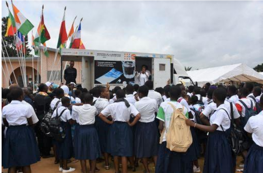
Projet de promotion de la Santé Sexuelle et Reproductive des Jeunes, Abidjan, ISSV

Certains facteurs aggravent également la situation sanitaire des femmes : le manque de contrôle sur les ressources, les violences sexistes, la charge de travail domestique et familial non rémunéré, la charge de travail accrue et des conditions de travail insalubres. Les normes genrées et les préjugés sexistes déterminent également la façon dont les besoins sanitaires des femmes sont perçus (ex. inadéquation de la médication) par les femmes et par le reste de la société.